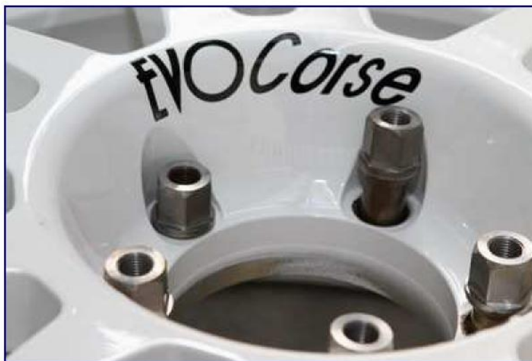
Kolesa so na voljo neposredno z novim QPS sistemom nameščanja.

QPS sistem je patentiran s strani EvoCorse